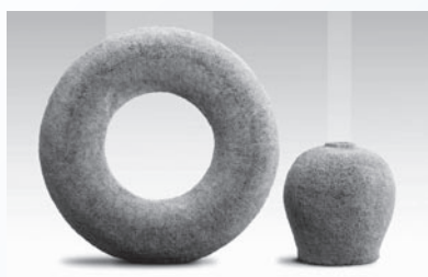
▲文化・文明の起源である稲から、感傷性をはじめさまざまな感情を“藁”で立体表現された作品展です。