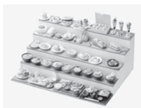
(左) ミニチュアフード展示作品。