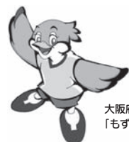
大阪府広報担当副知事「もずやん」