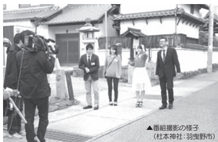
▲番組撮影の様子 (社本神社・羽曳野市)

地域と一体となって撮影が進められた映画の口ケ地を巡りながら、魅力あるまちの見どころが紹介されます。