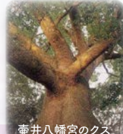
壺井八幡宮のクス