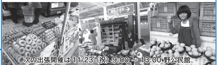
次の出張開催は11/23(祝)9:00～13:00 野公民館

10月12日(日)、恵我ノ荘駅前広場でもぎたての柿やみかん、名物のさいぼしなどを販売する19店舗が集まった軽トラ市が開かれました。広場に突然現れた半日限定マーケットに約1,000人が訪れ、お買い物を楽しまれました。また、同駅から阿部野橋駅に向かう家族づれは、旅先で食べる「おやつ」にと、みかんを購入され、電車に乗り込まれました。