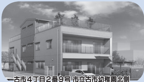
古市4丁目2番9号 市立古市幼稚園北側

古市複合館は、古市駅東地区に点在していた「青少年センター」「古市図書館」「子育て支援センターふるいち」を移転し、機能を集約することで、地域の子育てと青少年活動の拠点として事業を展開していきます。