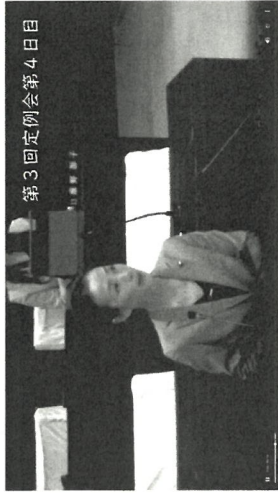
第3回定例会第4日目

PFS方式とは、従来の委託契約のように事業効果に関わらず、定額の委託料を支払うのではなく、「成果に対して支払う」成果運動型民間委託契約方式のことです。この方式の導入により、漠然と業務委託を行うのではなく、民間活力を最大限活かし最高の目的・目標達成を目指すことが可能になります。地方自治の本旨は、「最少の経費で最大の効果を得ること」です。今後も市民サービスの質の向上を目指し、改善と改革を実行してまいります。