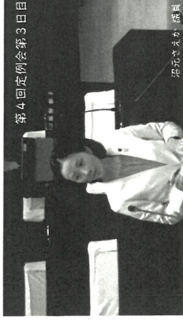
第4回定例会第3日目

一方、会計処理は概ね適正に行われており、将来の羽曳野市を見据えて、潤沢でない財政状況の中、行財政改革を行い懸命に新たな施策を実行したことは大変評価しており、必要性和優先度を明確にしたうえで、老朽化した施設やインフラ整備など先送りされてきた課題や、新庁舎建設など多額の事業費が継続的に発生することに対して、財政運営の見通しを立てるとともに、限られた予算内での選択と集中を進め、持続可能な財政運営を実現するために、中長期的な観点から行政運営に努めることなどを要望し、認定とする者4名(維新含む他)の、認定とする者多数により認定すべきとなりまりました。その他、報告2件は認定、議案2件は原案通り可決しました。