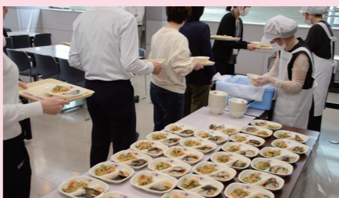
給食試食会の様子