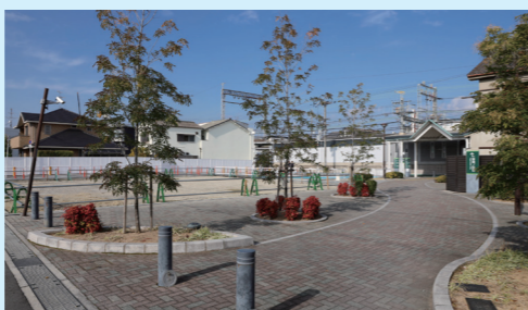
恵我ノ荘駅前南側広場

恵我ノ荘駅前の交通混雑解消及び歩行者等の安全を確保するため、駅前南側広場整備に向けた実施設計を行います。