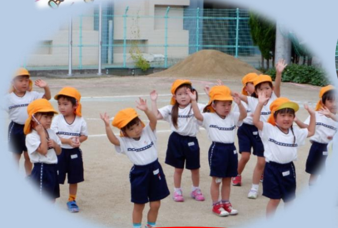
ひよこ組 かけっこ・ギャオドロンのダンス かわいかったね！