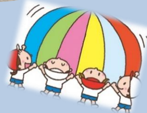
こあら組 カービィダンス・バルーン がんばりました！