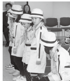
少し緊張? 6人の新入団生