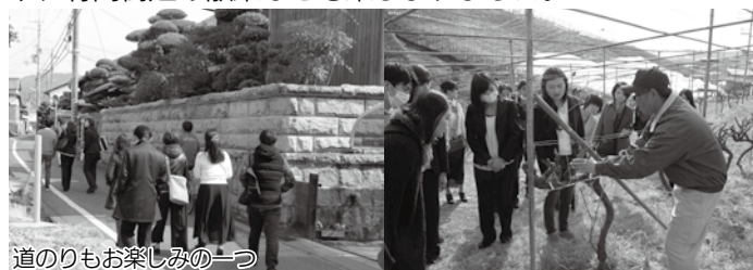
道のりもお楽しみの一つ

3月29日(休)、大阪市内のホテルコンシェルジュなど17人の方々が、羽曳野市のワイナリー3社を訪れました。大阪でワインが作られていることは“大阪人”の間でも最近になって知名度が上がってきた、というところですよ。そこで国内外の来阪観光客に、より「大阪」を楽しんでもらうため、まずは観光案内の最前線となる方々に、隠れた大阪の魅力を知ってもらおうという、大阪観光局によって実施された今回のモニターツアー。参加者のみなさんは、各社自慢のワインのほか、山の斜面を埋め尽くすぶどう畑の景色や、竹内街道の散策なども楽しめました。