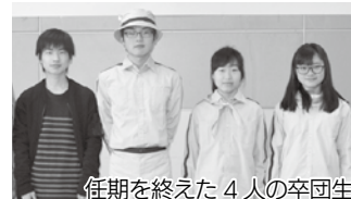
任期を終えた4人の卒団生

緑の少年団の卒団・退団(3月19日(日))および入団(4月2日(日))の式典が、それぞれ市役所で開催されました。卒団・退団の式典では、4月から高校生となった卒団生4人が「卒団生のことば」を述べ、退団生を含む38人と、記念品の贈呈やお別れ会などを行いました。そして迎えた入団式では、6人の新入団生が元気いっぱい入場行進。この日参加した16人の団員と一緒に、活動発表の練習やミニトマトの植え込みを行い、石川桜堤を散策するなど、充実したひとときを過ごしました。