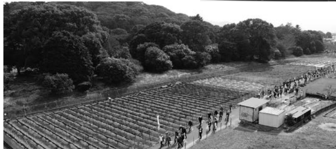
▲清掃活動をしながら歩く参加者を上空から撮影