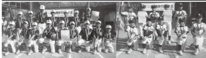
(Aクラス) 羽曳野イーグルス