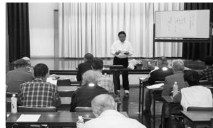
▲菊花講習会の様子