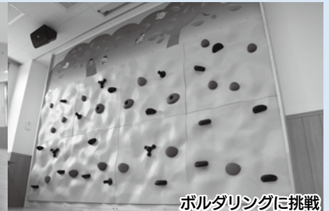
ボルダリングに挑戦