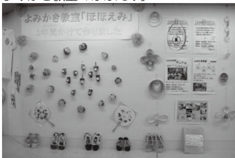
じしゅやかんちゅうがく 自主夜間中学