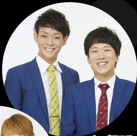
ネイビーズアフロ