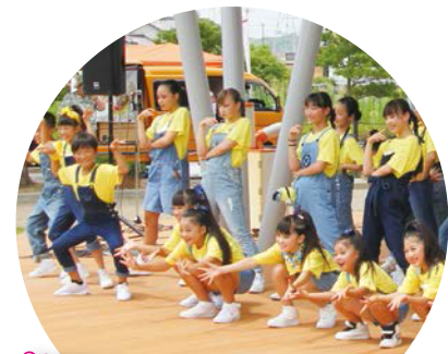
Cute/Cool! アスオーマンス HIRO DANCE COMPANY