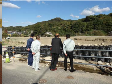
▲ 土砂災害などで甚大な被害を受けた坂町の坂地区

西日本豪雨被害の被災地支援のため、本市では、10月より6ヵ月間、2名(1名3ヵ月交代)の技術職員(土木)の現地派遣を決定、現在、広島県南西部で瀬戸内海に面している安芸郡坂町で日々業務に従事してくれています。