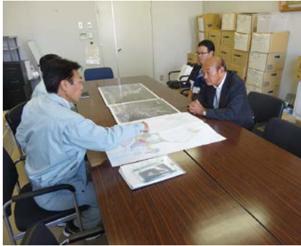
▲ 坂町の職員から被害状況を確認