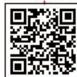
QRコード(大阪府) 土砂災害の防災情報