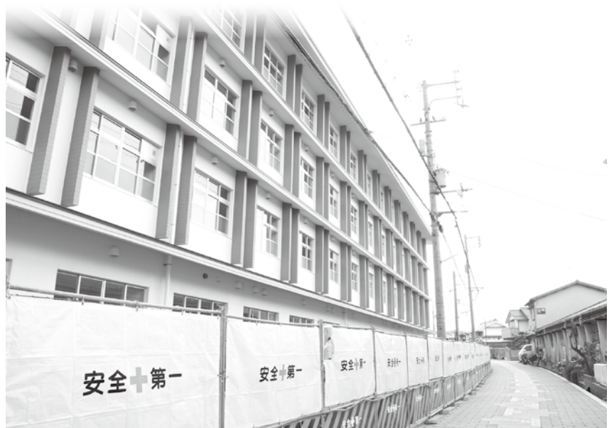
(新校舎西に延びる東高野街道)

いよいよ菅田中学校の新校舎が完成します。今月 29 日に竣工式典を行い、4月の新学期から全学年の新たな学び舎となります。