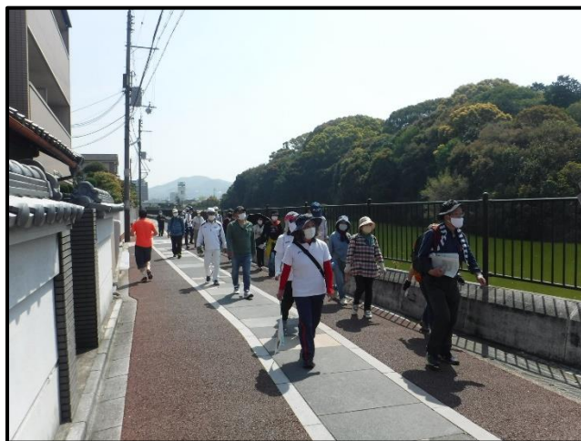
※写真は過去の実施風景

各スポットでは、文化財等に精通する本市職員による解説を交えながら、歩くたびに本市の魅力に触れ、知ることができ、また、運動不足の解消や心身の健康向上を図るウォーキングイベントとなります。