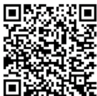
イベントなどの中止・延期