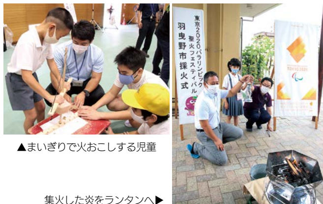
▲まいぎりでおこす児童

児童たちが採火した炎は、大阪府障がい者交流促進センターファインプラザ大阪へ集火され、東京へ向かいます。