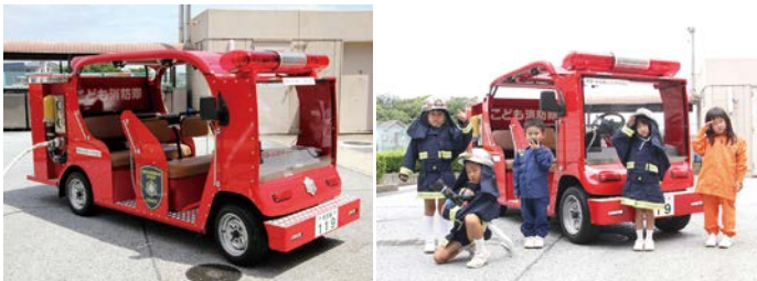
▲今月号の表紙を飾った、こども消防車と羽曳野市幼年消防クラブの白鳩幼稚園の園児たち