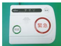
装置本体 「富士通 ホームナースコール」