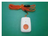
ペンダント型ワイヤレス通報装置