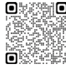
羽曳野市商工会ウェブサイト