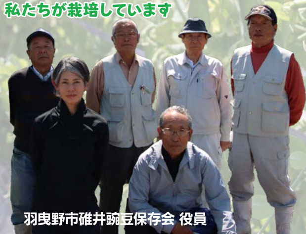
羽曳野市碓井豌豆保存会 役員

碓井豌豆は明治時代から現在までずっと自家採種を繰り返しているため、大阪府から「なにわの伝統野菜」の認証を受けています。一般に市場に出回っているカタカナ表記のウスイエンドウは、この「碓井豌豆」から品種改良されたもので、なにわの伝統野菜である「碓井豌豆」とはまた違います。