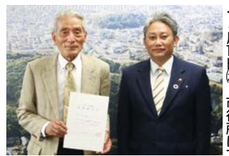
4月13日(火)、市役所にて

大阪府人権擁護士は、人権相談員をサポートし、人権課題を早期に解決に結びつけるとともに、人権侵害を未然に防止する役割を担っています。