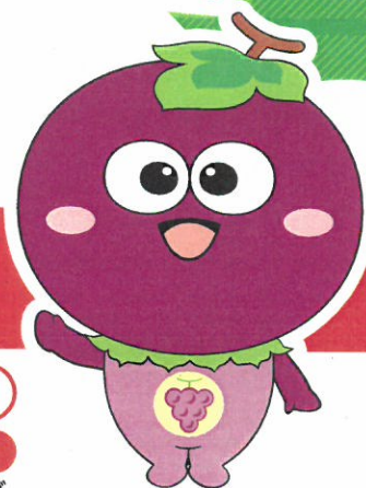
羽曳野市マスコットキャラクター 「つぶたん」