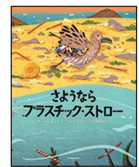
さようならプラス チック・ストロー 光村教育図書