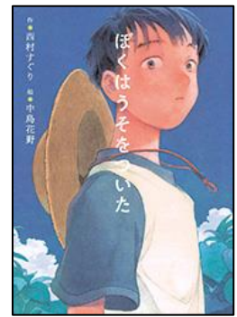
ぼくはうそをついた ポプラ社