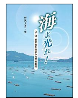
海よ光れ! 3・11被災者を励ました学校新聞 国土社