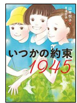
いつかの約束1945 岩崎書店