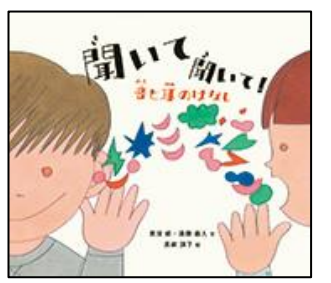
聞いて聞いて! 音と耳のはなし 福音館書店