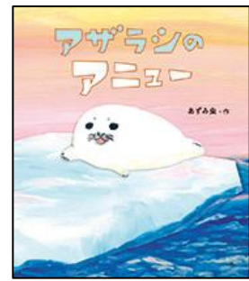
アザラシのアニュー 童心社