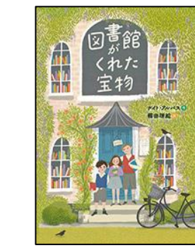
図書館がくれた宝物 徳間書店