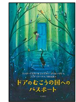
ドアのもうこの国 へのパスポート 岩波書店