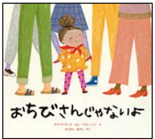
おちびさんじゃないよ イメージネーションプラス