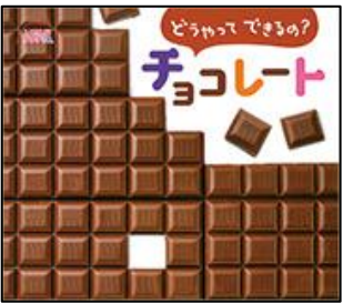
どうやってできるの? チョコレート ひさかたチャイルド