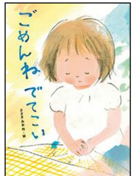
ごめんねでてこい 文研出版