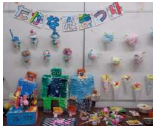
(南河内地区なかよし作品展での展示)