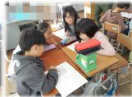
3年 算数 はかりを使って測定