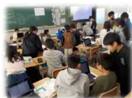
4年 算数 複雑な図形の面積の求め方

また、日常の学習活動でも、子どもたちは友だち・仲間とふれあい、ともに考え、助け合いながら成長しています。