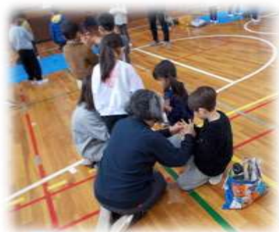
1年×地域 伝承あそび

さて、本校では、地域のゲストティーチャーの方々や保護者の皆様との出会いを通じて、新たな発見や学びを得る機会を大切にしています。コロナ禍以前から取り組んでいたことをそのまま復活させるということではなく、令和の時代にふさわしい方法や内容を模索しながら計画、実施しています。