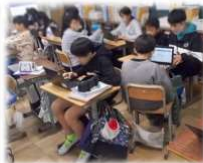
6年 理科 防災を考える

このように学校ならではの経験を積み重ねることで、学校教育目標「自ら学び、心豊かでたくましい子どもの育成」に近づくものと考えています。今後も、子どもたちが多くの出会いと学びを得られるよう努めてまいりますので、引き続きのご理解ご協力くださいますようお願いいたします。