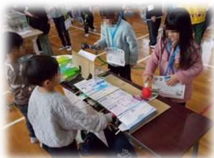
1年×2年×4年 たかなんまつり