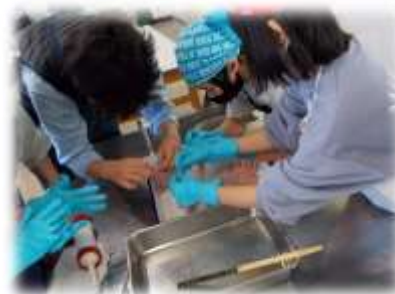
5年×タケダハム ソーセージづくり

また、日常の学習活動でも、子どもたちは友だち・仲間とふれあい、ともに考え、助け合いながら成長しています。