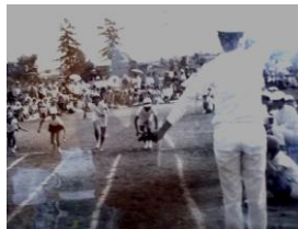
第1回運動会の様子

(HPアドレス) http://www.city.habikino.lg.jp/es/takam-s/index.html