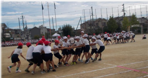
5年生「HOT ホット♡棒引き～」