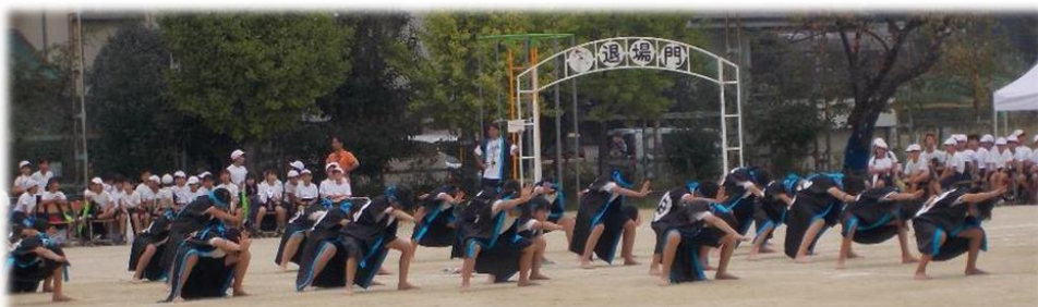
6年生「南小ソーラン～繋～」 国際色豊かな表現は、「繋」のあかし！