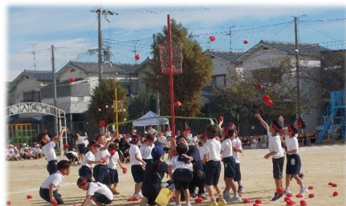
1年生「昭和DEダンス！！」(玉入れ)