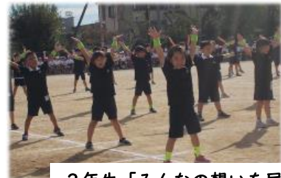
2年生「みんなの想いを届けよう ~wonderful show~」