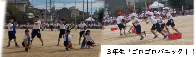
3年生「ゴロゴロパニック！！」