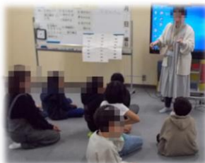
←のぞみ学級「みんなの時間」