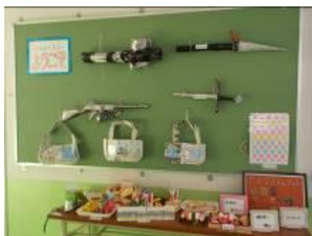
市・地区なかよし作品展作品

※運動会は、これまで日曜日開催としておりましたが、次年度より土曜日開催とします。準備から引き続き実施できること、けがや急病の際には医療機関への受診が可能なおことから判断いたしました。ご理解のほどよろしくお願いいたします。